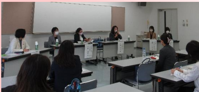
【昨年のパネルディスカッションの様子】