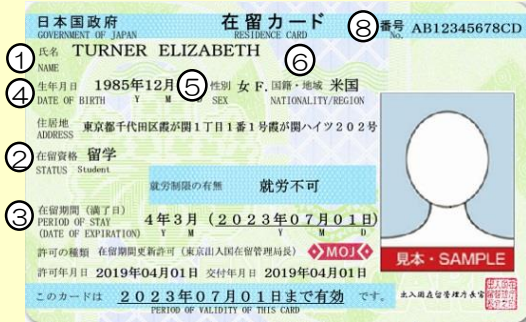
在留カード例（表面）