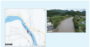
管理プラットフォーム(映像配信)