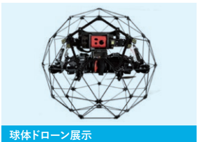
球体ドローン展示