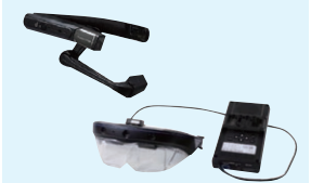
ARゴーグル遠隔支援①②