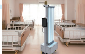
殺菌灯搭載ロボット