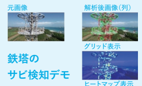
鉄塔のサビ検知デモ