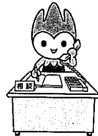
山口県PR本部長ちよるる

賃金、労働時間、退職、解雇、パワハラなど、労働問題に関するご相談に、専門の社会保険労務士がお応えします。