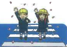
歩行中児童の学年別負傷者数 (過去5年)【山口県内】