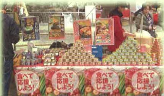
被災地産食品の販売フェア