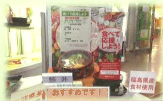
被災地産食品を使用したメニューの提供