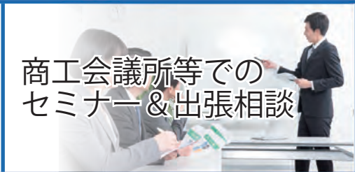
商工会議所等でのセミナー&出張相談

電話やメールフォームでも相談できるので、移動に時間を割くことなく好きなタイミングに相談が行えます。 ※来所の場合はご予約が必要です。